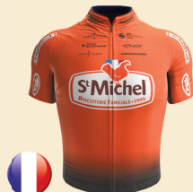
St MICHEL AUBER 93