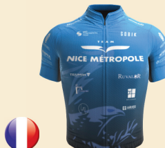
NICE METROPOLE COTE D'AZUR