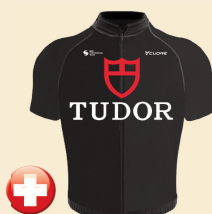
TUDOR PRO CYCLING TEAM