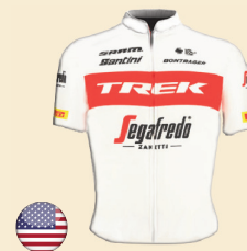
TREK - SEGAFREDO