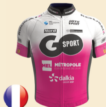
GO SPORT - ROUBAIX LILLE METROPOLE