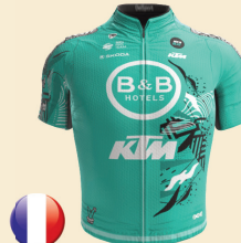
B&B HOTELS - KTM