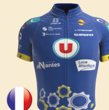
TEAM U NANTES ATLANTIQUE