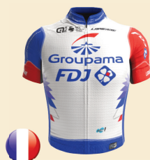
GROUPAMA - FDJ